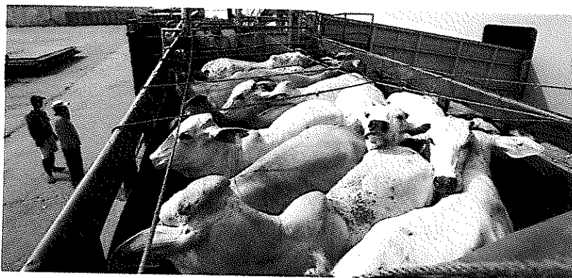
הבלת בקר